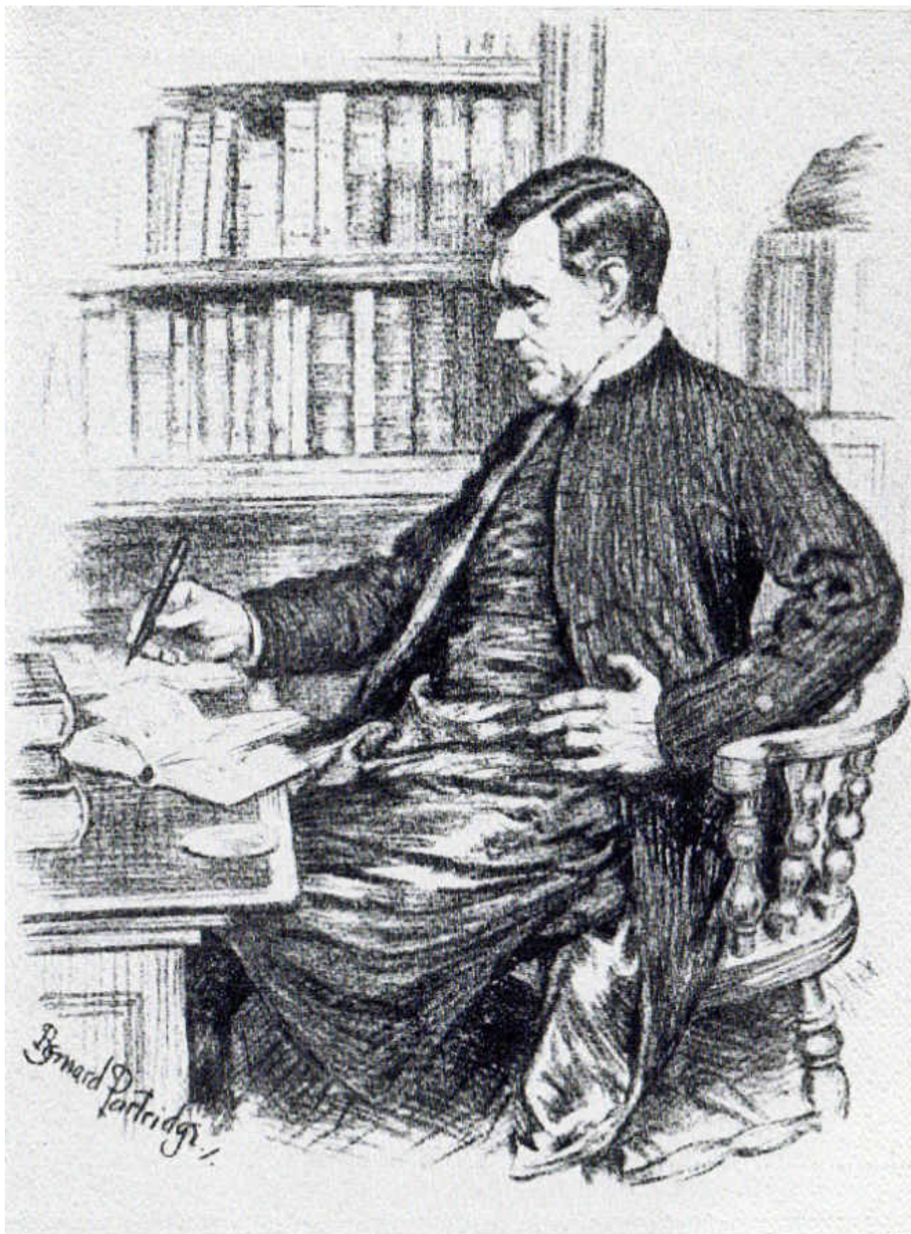
William Ralph Inge. Teckning i tidningen "Punch", London

Dean Inge var knappast "skomakaren som förblir vid sin läst". I 25 års tid verkade han som kolumnist i Londontidningen "The Evening Standard". Det var här, på grund av sina pessimistiska uttalanden om världen och mänskligheten, som han började bli känd under namnet "The Gloomy