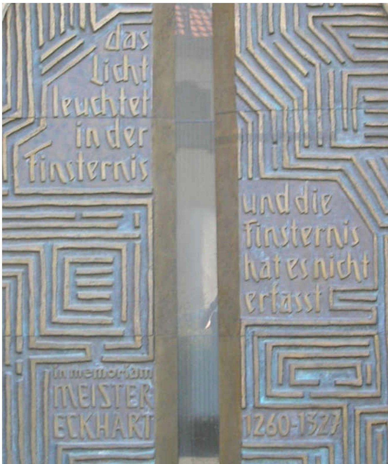
Ljuset lyser i mörkret, och mörkret har icke fått makt därmed, Eckart-portal i Erfurts Predigerkirche.

Även om Dean Inge i "den eviga filosofin" ser ett gemensamt fundament för all andlighet och all religiös tanke och praxis, förlorar han inte för ett ögonblick det unika för kristendomen ur sikte. Då han behandlar den kristna mystiken gör han det i nära anslutning till Johannesevangeliet, som oupplösligt förenar tron med kärleken. Johannes ständigt upprepade uppmaning: "Älska varandra!" är själva nyckeln till den nära gudsförening som kristen mystik syftar till.