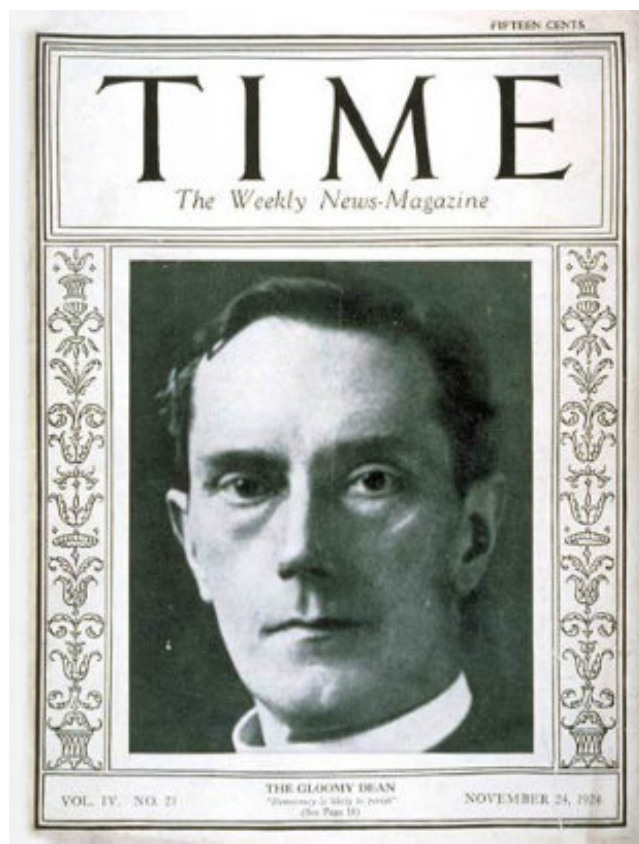
TIME Magazine med William R. Inge Nov. 24, 1924

Man finner egentligen ingenting särskilt spektakulärt i hans liv och karriär, förutom hans häpnadsväckande intellektuella begåvning och brådmogenhet. Genom sina båda lärda föräldrars försorg kom han att behärska latin och grekiska i stort sett på universitetsnivå redan före puberteten. Han kom från en prästfamilj i Yorkshire med rötter i 1800-talets anglikanska högkyrklighet, den s.k. traktarianismen – en tradition han själv i allt väsentligt skulle distansera sig från som präst och teolog (se t.ex.