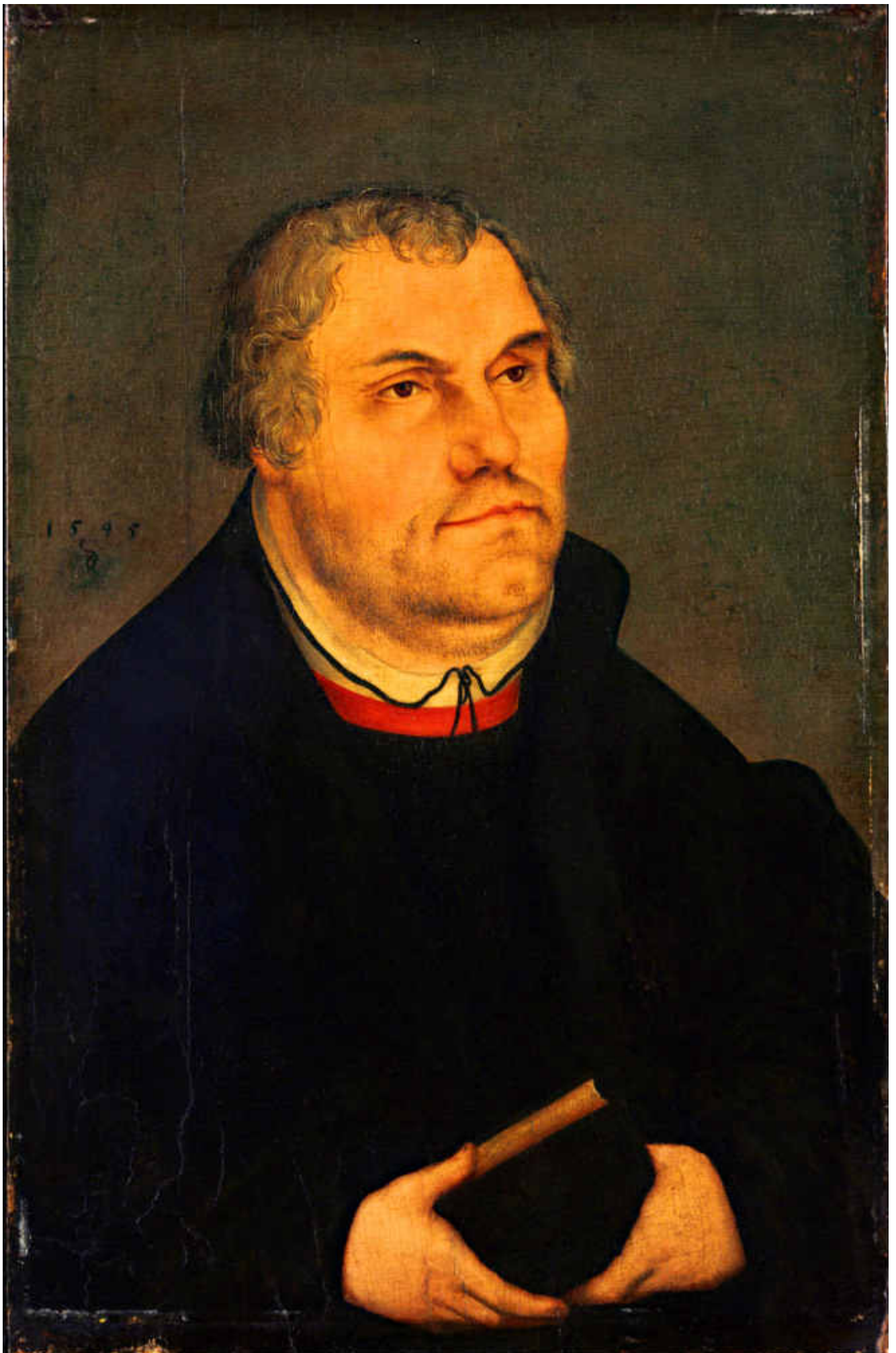
Porträtt av Martin Luther. Målning av Lukas Cranach d.y.