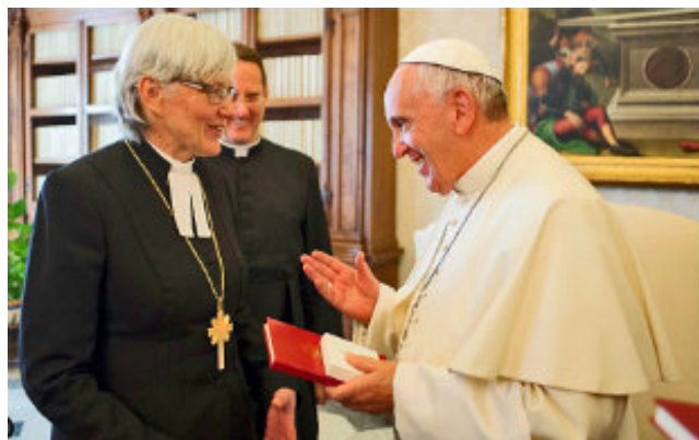
Påve Franciskus och ärkebiskop Antje Jackelén.

Det vill säga, med ett ganska kännetecknande undantag: Sverige. Här inträffar, provinsialt särpräglad, reformationsdagen på våren och knyter istället an till Uppsala mötes beslut 1593, då reformationen i dess slutliga form genomdrevs i landet.