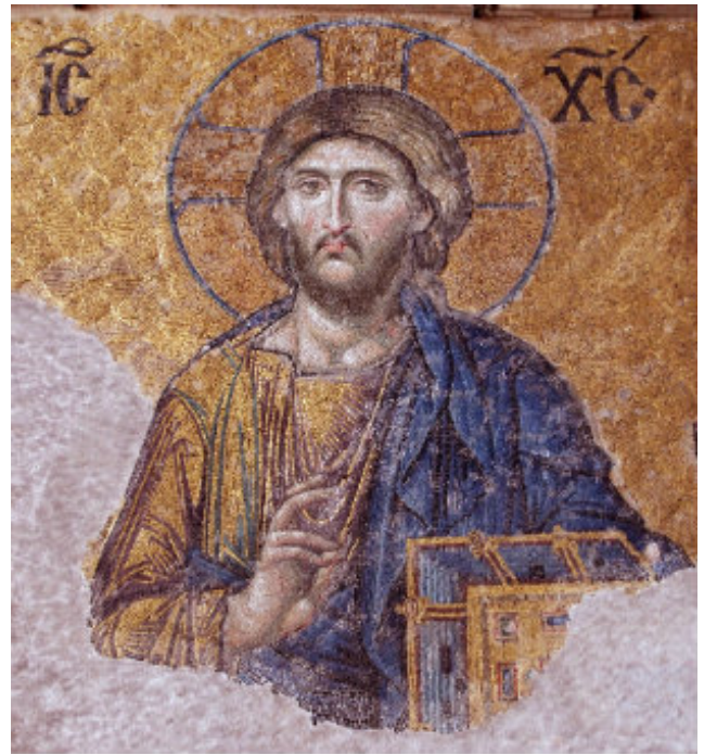
Kristus-mosaik, Hagia Sofia, Istanbul.

än till den Jesus som välte ikull månglarnas bord i templet.