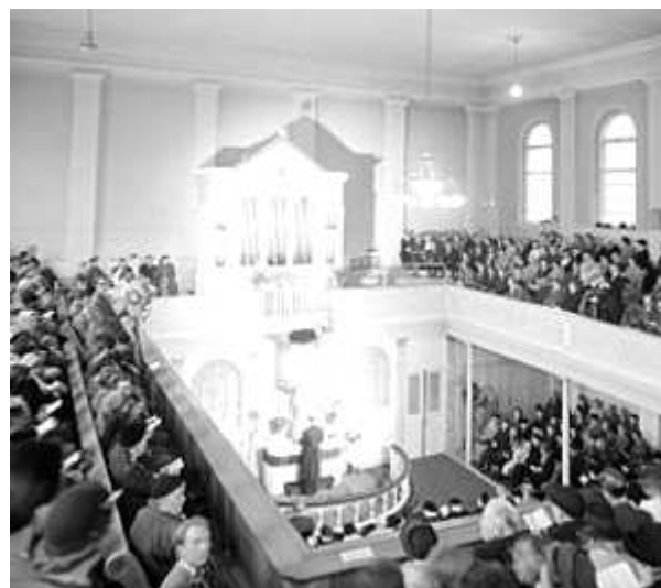
Gamla Betlehemskyrkan i Stockholm. Fotot taget 1953, vid den sista gudstjänsten innan kyrkan revs.

Sjukdom och ohälsa följde Lina Sandell under hela hennes liv, och trots detta var hon in i det längsta oförtrutet verksam som diktare, redaktör och översättare. I ett brev skriver hon att hon känner sig "gammal och trött" – hon är vid den tidpunkten 37 år gammal!