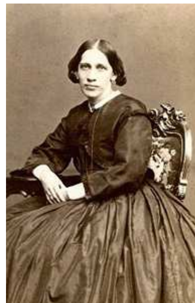
Lina Sandell, foto 1870-talet.

huvudsakliga källa till kunskap om Lina Sandells liv finns i hennes talrika brev och dagboksanteckningar. Vi vet således att hon var drabbad av återkommande infektionssjukdomar och att hennes skolgång helt och hållet ordnades genom att hennes far gav henne privatundervisning. Ett hörn i faderns arbetsrum inreddes som hennes studerkammare, och en mer kompetent privatlärare hade hon knappast kunnat få under de förhållanden som rådde i en landsbygdsförsamling i Sverige vid 1840-talets början.