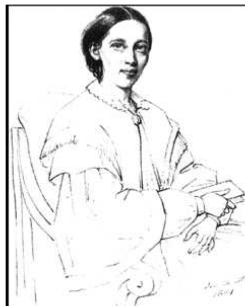
Lina Sandell, tecknat porträtt av Maria Röhl 1861. Kgl. Biblioteket, Stockholm.