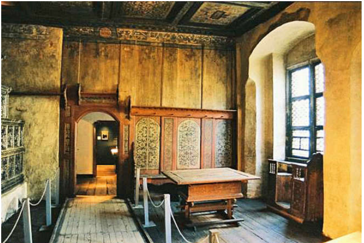
Rummet i Wittenberg där bordssamtalen hölls.

Men det kommande jubileet kommer säkerligen också att medföra åtskilligt av både kritik och självkritik. Jämsides med den rena Lutherforskningen borde det också ges plats för forskning i den reformkatholicism och reformhumanism, som vi finner ansatser till hos till exempel Erasmus av Rotterdam, men som hamnade i skuggan av Luther och Calvin och den katolska motreformation som väntade runt hörnet när reformationsrörelsen nådde sin höjdpunkt.