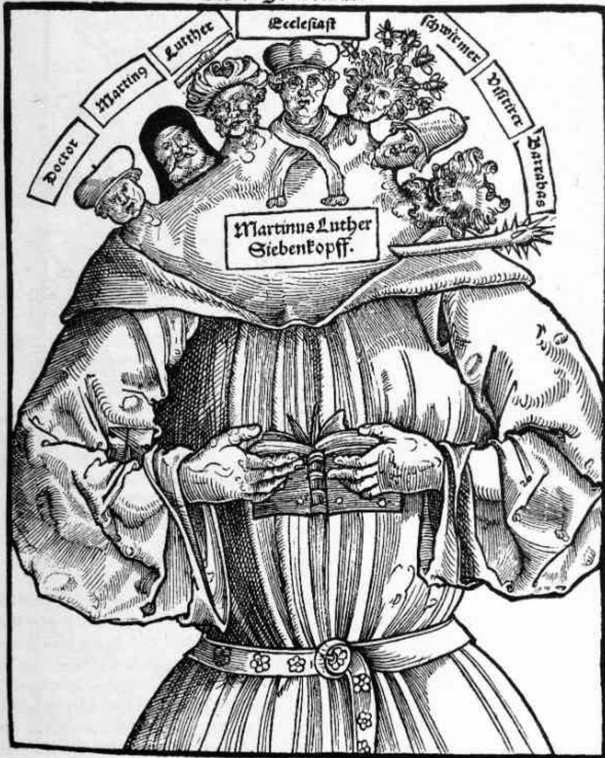
Luther med sju huvuden. Samtida nitbild, träsnitt.