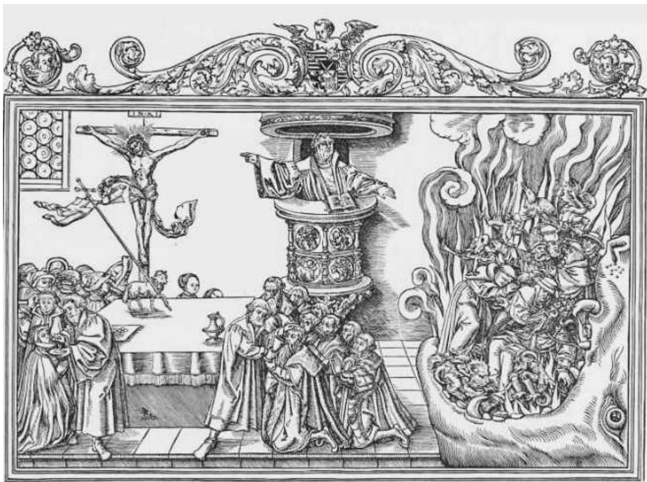
Lucas Cranach d.y.: Den nya evangeliska gudstjänsten (och den gamla katolska till höger).