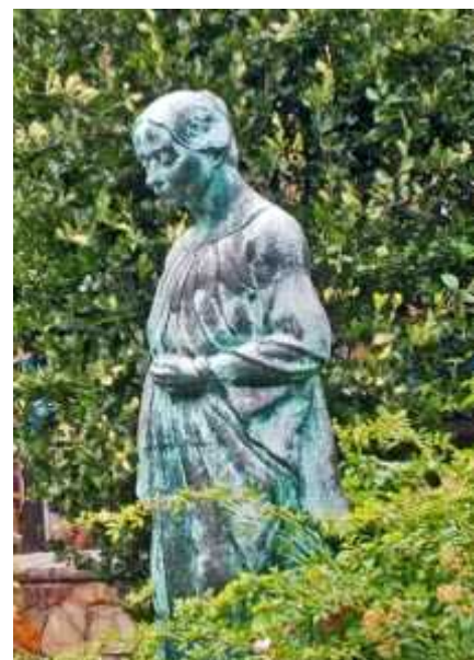
Ellen Key. Skulptur i Ellen Keys park, Stockholm